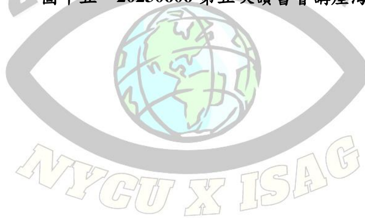
圖十五、20230606 第五次讀書會講座海報