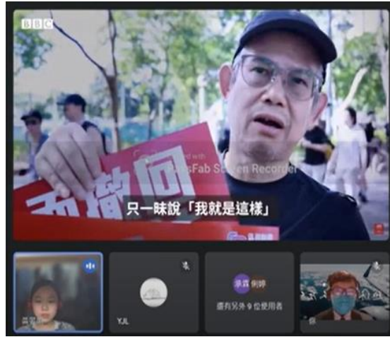
圖二、2023/04/18 第一次讀書會工作坊照片

這張合照捕捉了讀書會結束時的歡樂氛圍。大家聚在一起，深入探討了「中國如何壓制香港？」以及「香港人的身份認同」等重要議題。第一次的讀書會就帶給我們更廣闊的視野，也體會到了彼此的不同觀點和價值觀，每個人都帶著自己的獨特背景和觀點，通過討論和分享，我們一起成長、一起學習。這次的活動給予了我們思考和討論的機會，並促使我們更加關注國際事務和身份認同等議題。見證了我們在讀書會中的互相尊重、學習和成長。