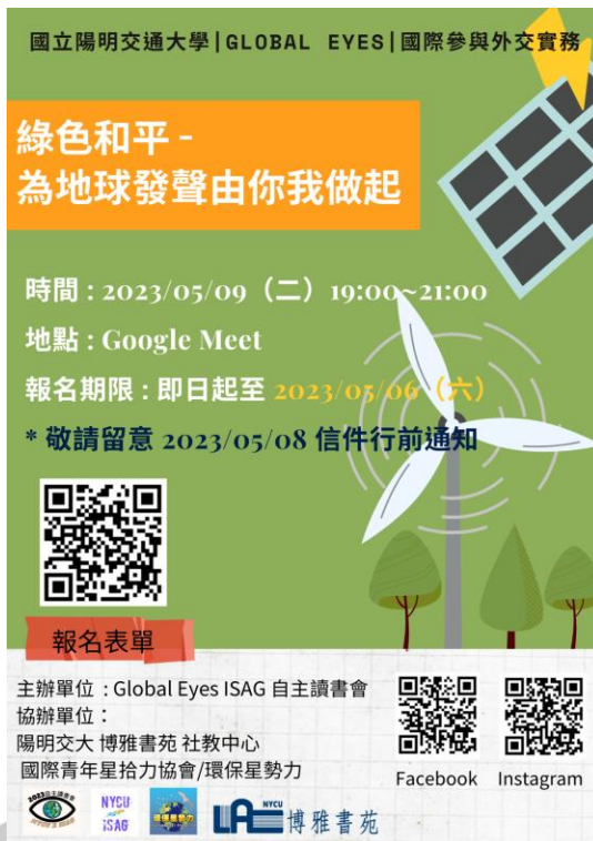
圖十三、20230509 第三次讀書會講座海報