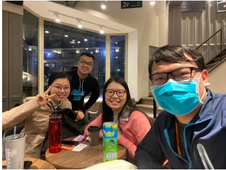
圖十、讀書會團員線下討論合照 (2)

在幾乎大部分活動都是線上舉辦之後，大家百忙之中抽空見面吃飯，藉由實體互動的方式也更加了解彼此，在開心用餐之餘，幹部們也一起討論這樣的活動未來將如何進行，兩校區不同專業領域以及多元的觀點之下也交流出許多火花。