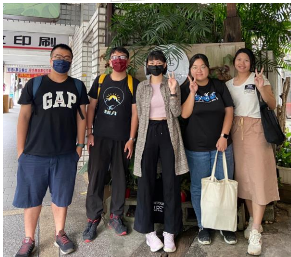
圖九、讀書會團員線下討論合照 (1)

「海外志工服務分享」的活動合照捕捉了我們對於講師獨特經驗的共鳴與感動。講師為當地國小製作樹屋和鞦韆等，展現了他的創意和熱情。我們在他的分享中學到了課堂上無法獲得的知識，深深感受到國際志工服務的價值和多元性。講師在行前準備中投入了大量的活力和熱誠，包括了解當地文化、設計構圖和準備物資，這一切都不容易。透過這張合照，我們見證了志工服務的熱忱和價值，並被講師以故事性的描述所吸引。感謝講師帶給我們精彩的演講，激發了我們對參與志工行列的渴望。