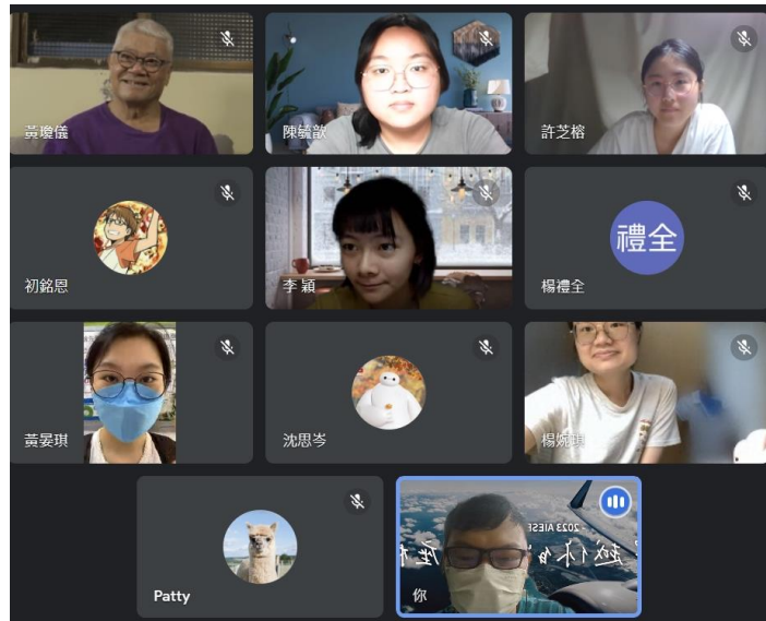
圖八、2023/06/06 第五次讀書會合照

「海外志工服務分享」的活動合照捕捉了我們對於講師獨特經驗的共鳴與感動。講師為當地國小製作樹屋和鞦韆等，展現了他的創意和熱情。我們在他的分享中學到了課堂上無法獲得的知識，深深感受到國際志工服務的價值和多元性。講師在行前準備中投入了大量的活力和熱誠，包括了解當地文化、設計構圖和準備物資，這一切都不容易。透過這張合照，我們見證了志工服務的熱忱和價值，並被講師以故事性的描述所吸引。感謝講師帶給我們精彩的演講，激發了我們對參與志工行列的渴望。