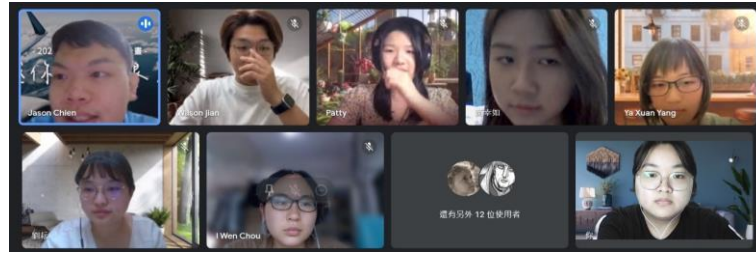
圖六、2023/05/16 第四次讀書會合照