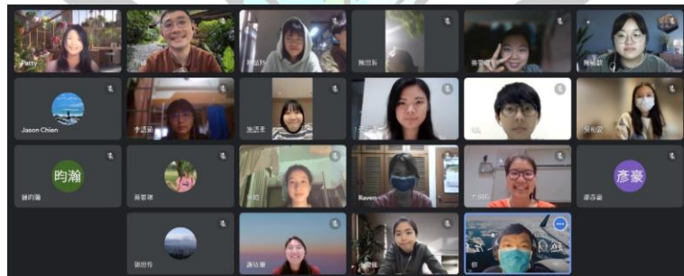
圖三、2023/04/25 第二次讀書會合照

這張合照捕捉了讀書會結束時的歡樂氛圍。大家聚在一起，深入探討了「中國如何壓制香港？」以及「香港人的身份認同」等重要議題。第一次的讀書會就帶給我們更廣闊的視野，也體會到了彼此的不同觀點和價值觀，每個人都帶著自己的獨特背景和觀點，通過討論和分享，我們一起成長、一起學習。這次的活動給予了我們思考和討論的機會，並促使我們更加關注國際事務和身份認同等議題。見證了我們在讀書會中的互相尊重、學習和成長。