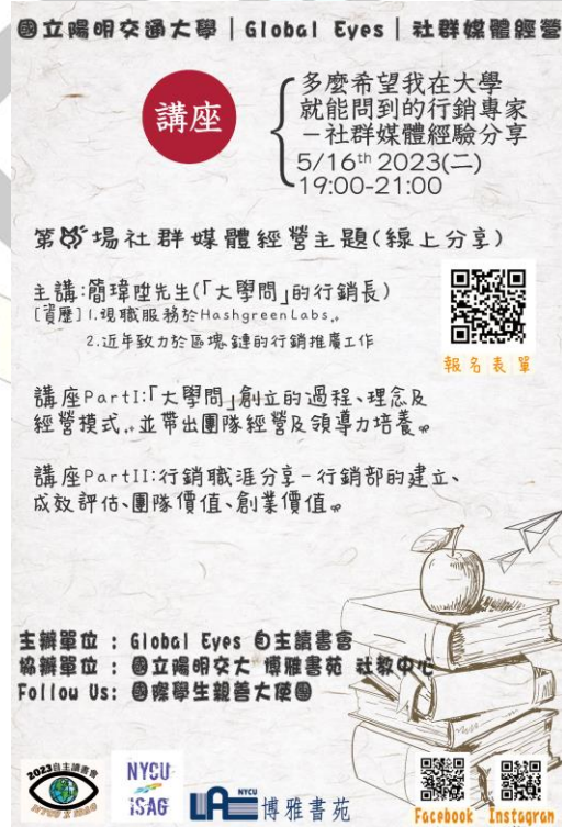
圖十四、20230516 第四次讀書會講座海報