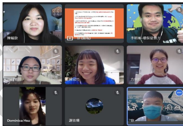
圖五、2023/05/09 第三次讀書會合照 (2)

講師的啟發性分享讓我們意識到永續行動的多元性，不僅限於環保，還包括社會等方面。我們被講師的感染力所深深吸引，即使對這個領域還不熟悉，仍然很開心認識了大家！在這次分享中，我們的對永續和環保的定義被打破，也認識到自己對許多事物存在偏見。作為領導者，我們承諾帶領大家為這個世界採取行動，帶來改變。我們將響應環保議題，在日常生活中使用環保餐具，繼續參與志工服務，並希望能夠進一步影響體制和立法。我們將努力減少使用一次性餐具，並計劃在暑假與朋友一起實地擔任環境志工，更積極履行對環境的責任。這張合照記錄了我們對永續發展的承諾和行動，一同為可持續的未來而努力。