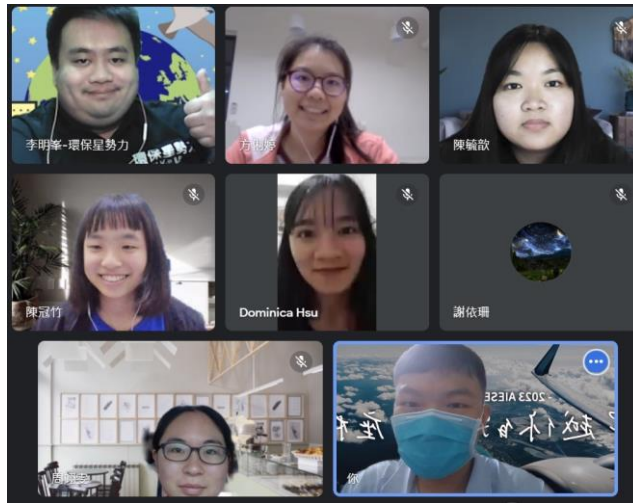
圖四、2023/05/09 第三次讀書會合照 (1)