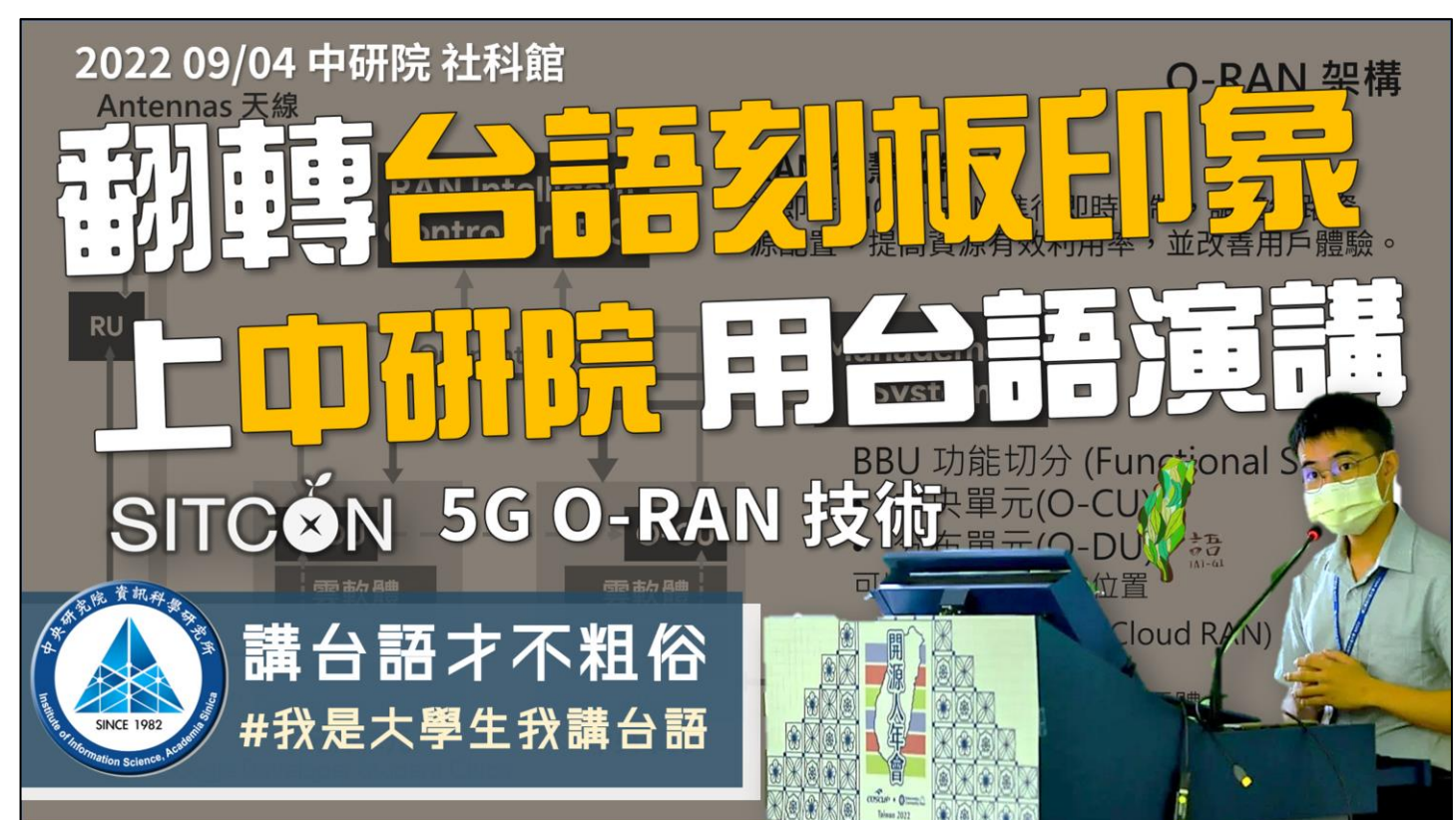
中研院 5G O-RAN 技術 全台語演講

我們只是一群大一學生，我們沒有資本、沒有背景所以我們努力大聲疾呼，為了受到矚目！參與了許多政府及民間計畫，並取得不錯的成績