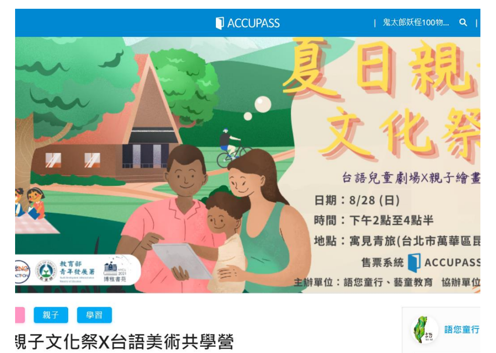
刊登活動通平台 舉辦在地活動 台語X美術親子共學營 活動通宣傳資訊