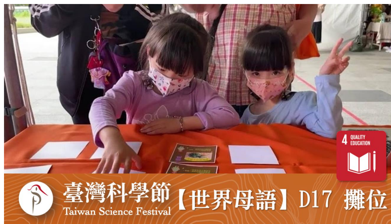
國立臺灣科學教育館 台灣科學節攤位 團隊願景是替 SDGs 4 優質教育、語言傳承提出解方 語言傳承是需要多代共同努力的過程，所以我們在科學節設攤與不同年齡層的民眾，推廣團隊 語言傳承 理念