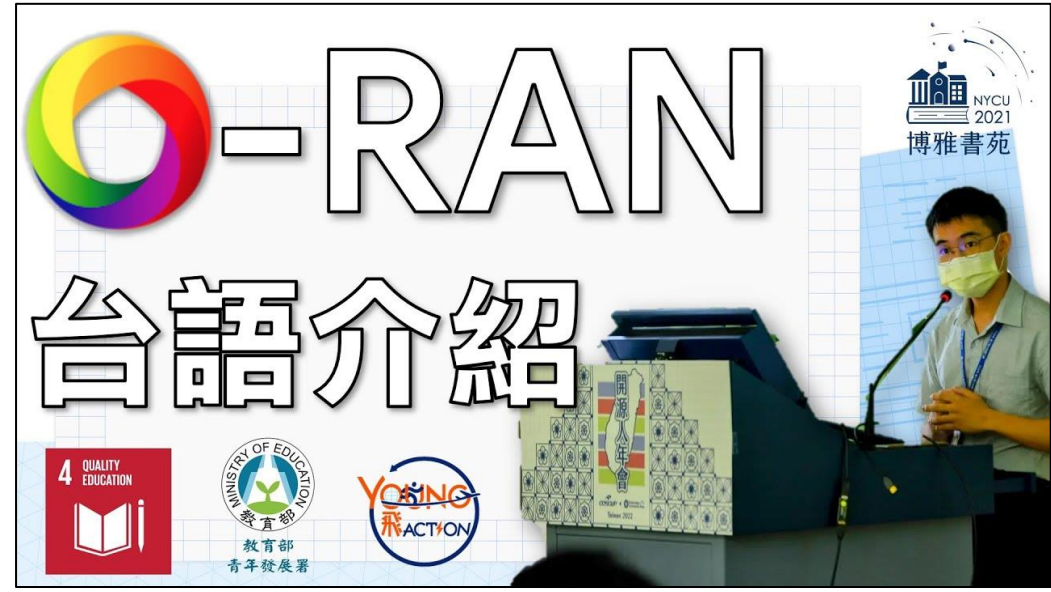
蔡秀吉 交大校區 百川學程 二年級 【台語科普】5G O-RAN 是什麼？